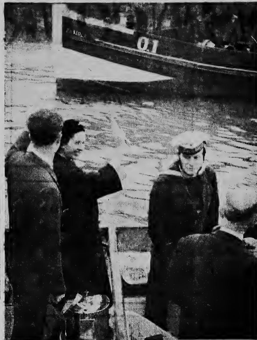
REY BOUDEWIJN I REINA FABIOLA TA TUMA NAN REGALO MATRIMONIAL NA OOSTENDE — Riba dos dia di Pascu Su Mahestad Boudewijn, rey di Belganan i reina Fabiola a tuma nan regalo matrimonial na Oostende, cu tabata consisti di un boto piscado „Fabiola“. Den un motorvlet di marina Belga, e pareja real hariendo ta bai abordo di „Fabiola“, cual boto nos ta mira atras riba e portret aqui.